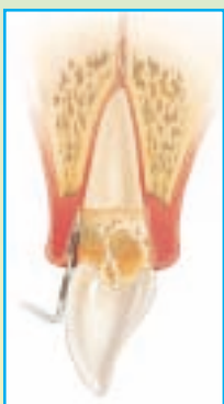
Fig. 1.1 Profundidad de Sondeo para Periodontitis Moderada-Avanzada

Durante una visita para el PMP, su dentista o periodoncista pone al día su historial médico y dental para anotar cualquier factor que pueda