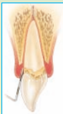
Fig. 1.2 Profundidad de Sondeo para Periodontitis Leve